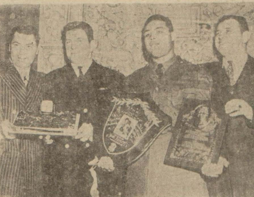
Dünya boks şampiyonları asker: Soldan sağa doğru eski dünya şampiyonlarından Dempsey, Tunney, bugünkü şampiyon Joe Louis ve Braddock. (Bunlardan Tunney Amerika bahriyesinde mülâzimidir. Joe Louis ise Suriyedeki Amerikan takviye kıt'aları...

Bundan evvelki yazımızın intidahi diğer mintakalarda da yer yer hareketler eksik olmamış, Almanlarla müttefikleri Karadeniz sahilindeki Tuapse'ye biraz daha yaklaşmış ve Stalingradın içinde temizleme hareketlerinden başka daha bazı mahal meyen bir şiddetle devam etmiş, (Devamı 5 inci sayfa)