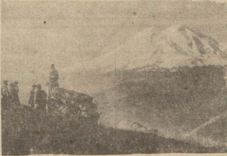
Kafkasyada Elbrez tepesinde Alman asker.

Nevyork, 22 (A.A.) — Berne den Nevyork Timese gönderilen bir telgrafa göre, İtalya kralı Victor Emanuelin Sanrossore sarayında ağır hasta olduğu bildirilmektedir. Kralın müdavi doktoru Çarşamba günü öğle vakti yanındaki dört mütebassisla Romadan ayrılmıştır. Veliahd prensin bir bomba uçağı ile Sanrossoreye gittiği bildirilmiştir.