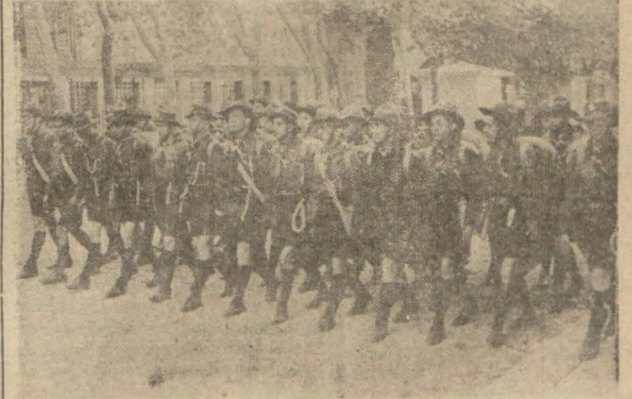
Ankarada hareket eden İstanbul lisesi izcileri mekteplerinden ayrılmadan önce

Ankaradaki geçid resmine iştirak edecek izciler dün şehrimizden avrıldılar